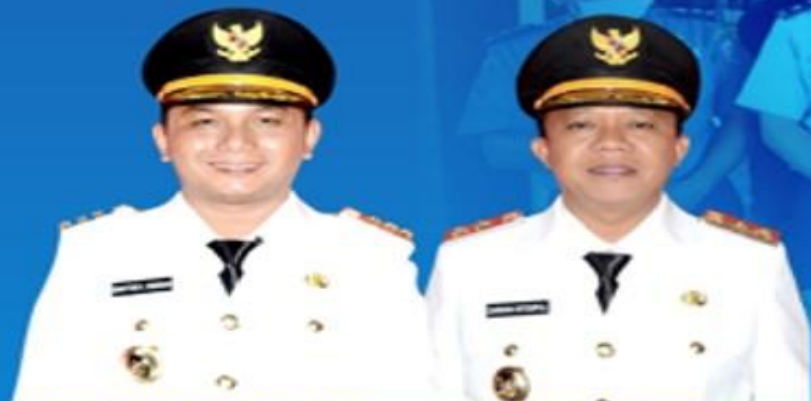
BAKHTIAR AHMAD SIBARANI BUPATI TAPANULI TENGAH

UPDATE DATA PASIEN PADA TANGGAL 18 APRIL 2020