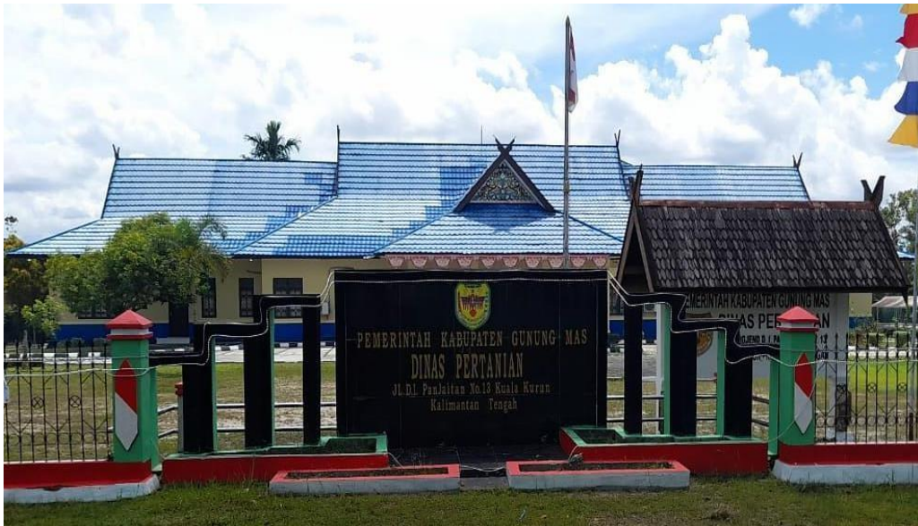
Gambar 1. Gedung Kantor Dinas Pertanian Kabupaten Gunung Mas.

Berdasarkan Peraturan Bupati (PERBUP) No. 4 Tahun 2022 tentang Kedudukan, Susunan Organisasi, Tugas dan Fungsi Serta Tata Kerja Dinas Pertanian Kabupaten Gunung Mas mempunyai tugas pokok membantu Bupati melaksanakan urusan pemerintahan yang menjadi kewenangan daerah dan tugas pembantuan di bidang Pertanian sesuai dengan kebijakan yang ditetapkan berdasarkan peraturan perundang-undangan yang berlaku. Kantor Dinas Pertanian Kabupaten Gunung Mas dapat dilihat pada Gambar 1.