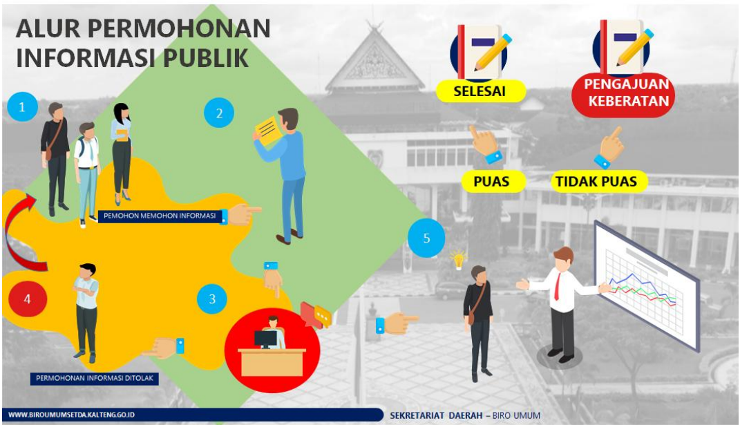
Gambar 2.2. Alur Permohonan Informasi Publik

Selain alur permohonan Informasi Publik, sebagai salah satu upaya untuk pelayanan publik, Biro Umum Setda Provinsi Kalimantan Tengah juga memiliki jam atau jadwal operasional pelayanan Informasi Publik, dengan gambaran sebagai berikut :