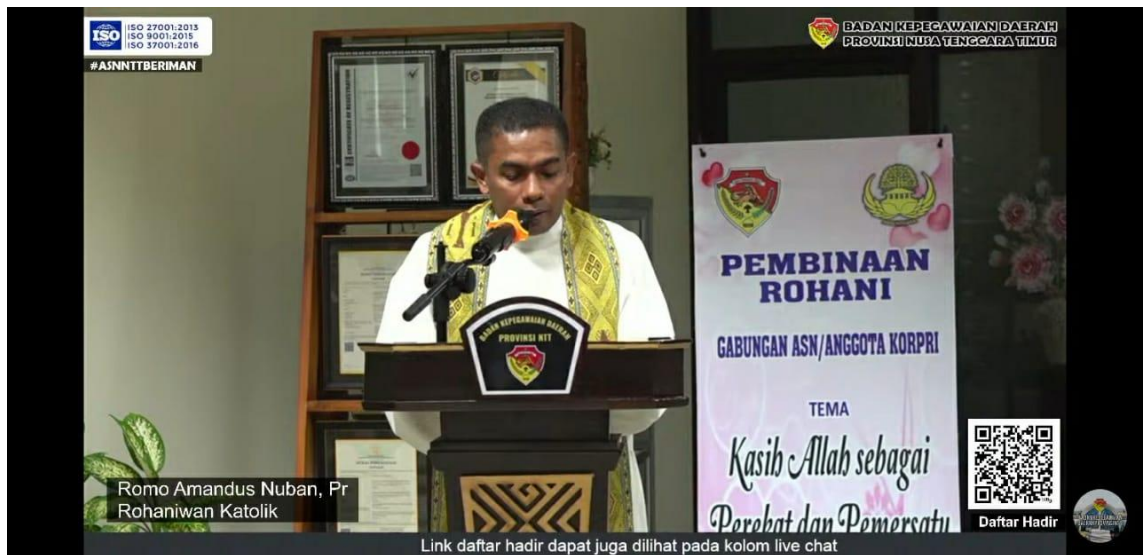
Foto kegiatan Pembinaan Rohani secara Virtual