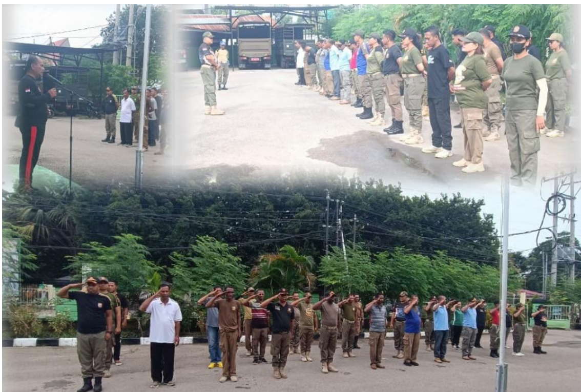
Foto kegiatan Kesamaptaan (PBB) bagi seluruh Anggota Satpol PP Provinsi NTT