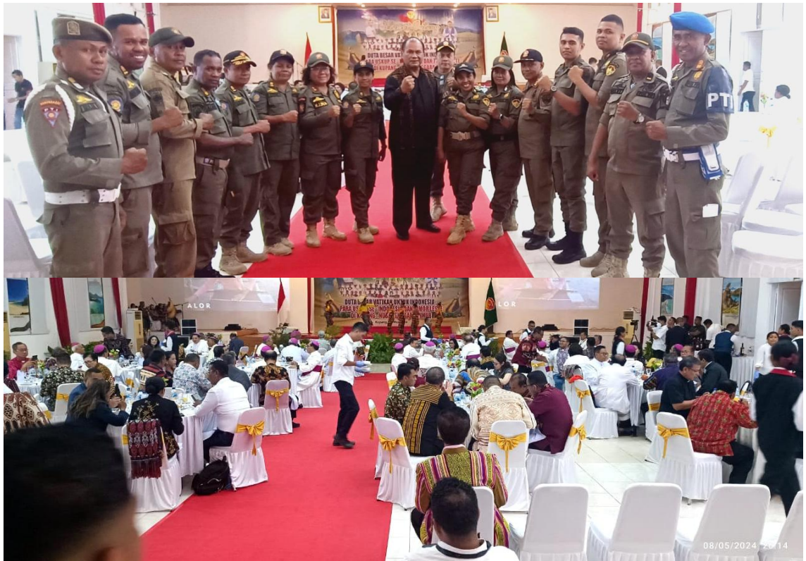
Foto kegiatan Duta Besar Vatikan untuk Indonesia, Para Uskup se-Indonesia dan Timor Leste