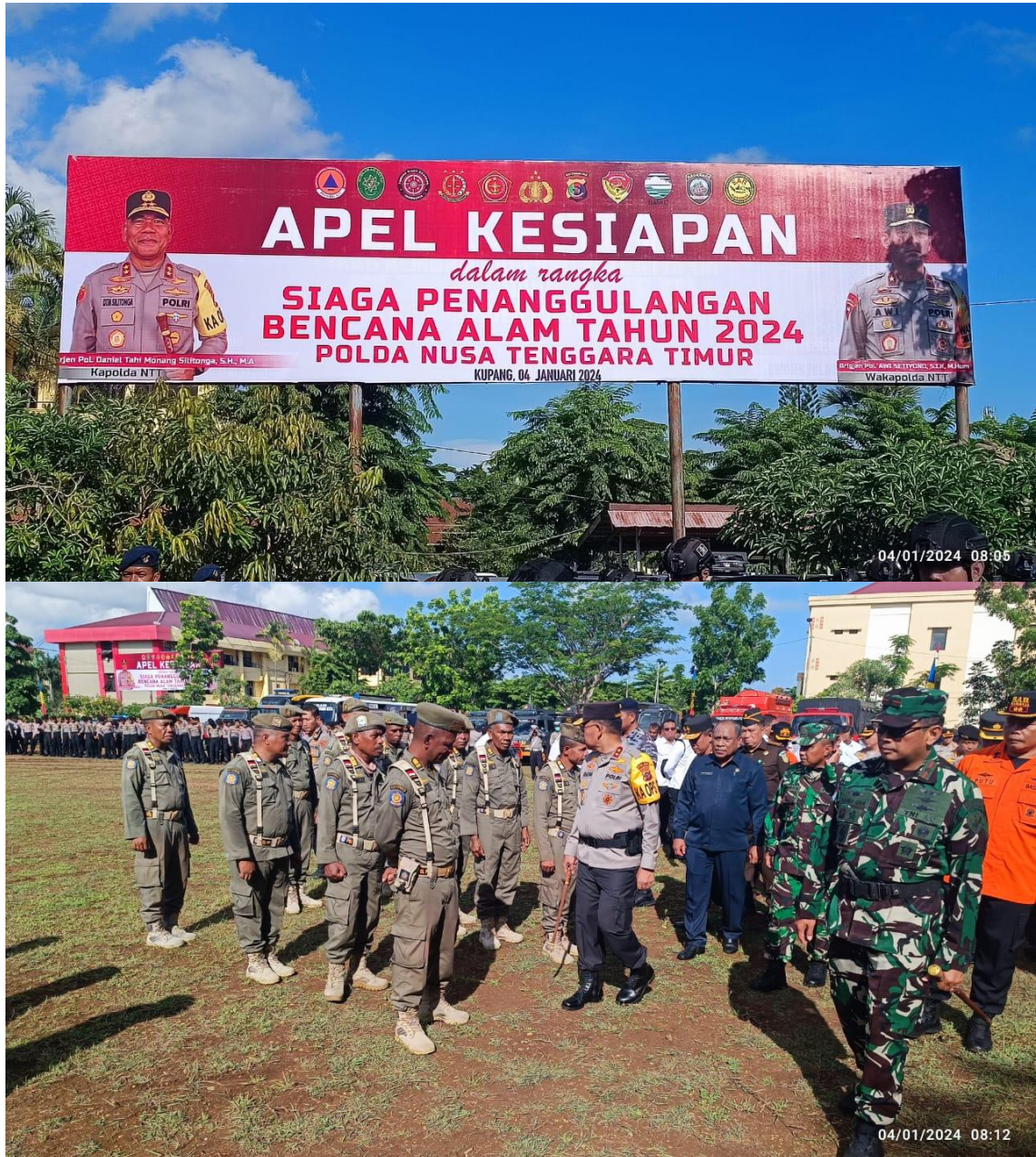
Foto kegiatan Apel Kesiapan dalam Rangka Siaga Penanggulangan Bencana Alam Tahun 2024 di Polda NTT