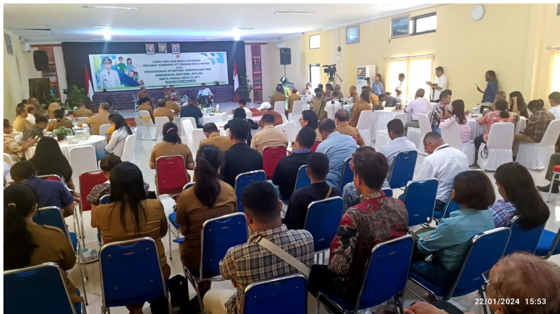
Foto kegiatan Jumpa Pers dan Media Gethering Penjabat Gubernur NTT dengan Media Massa tentang Penanganan Stunting, Kemiskinan dan Kemiskinan Ekstrem, Inflasi serta Pemilu 2024 di NTT