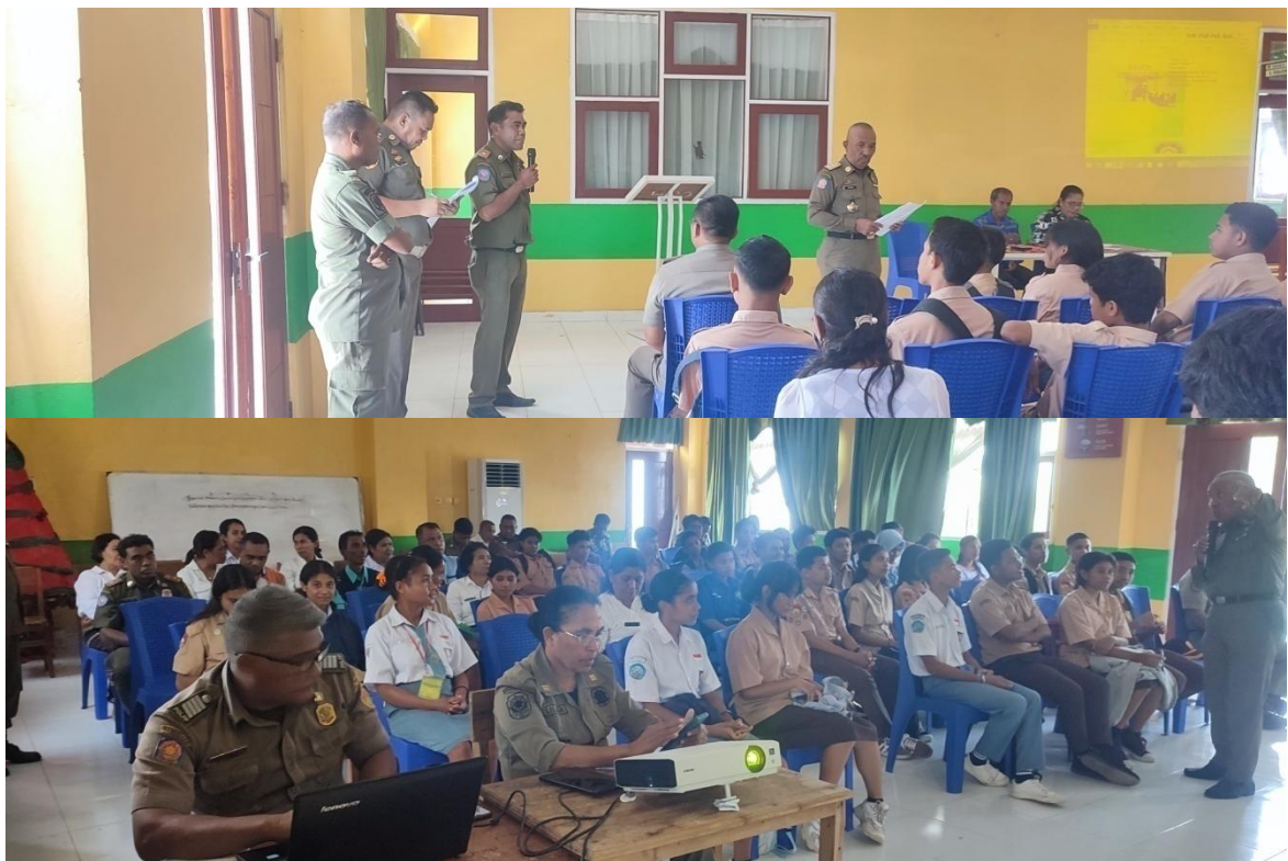
Foto kegiatan Sosialisasi Pelaksanaan Perda/Perkada di SMK Negeri 5 Kupang