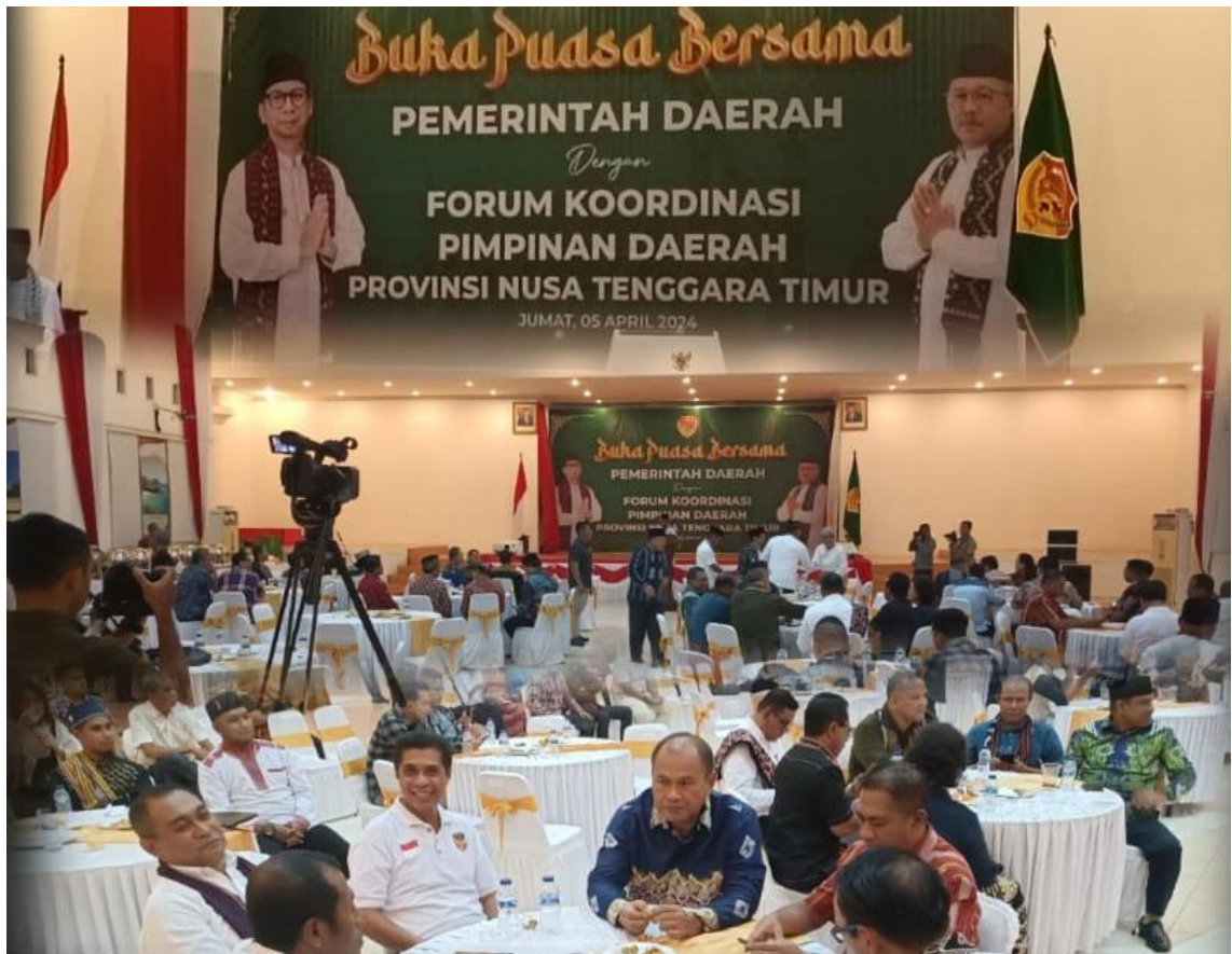
Foto kegiatan Buka Puasa Bersama Pemerintah Daerah dengan Forum Koordinasi Pimpinan Daerah Provinsi NTT

Pengamanan Pengambilan Janji Jabatan dan Pelantikan Penjabat Bupati Kupang dan Penjabat Bupati Ende oleh Penjabat Gubernur NTT atas nama Presiden Republik Indonesia serta Pelantikan Penjabat Ketua Tim Penggerak PKK Kabupaten Kupang dan Kabupaten Ende bertempat di Aula Eitari Kupang 07 April 2024