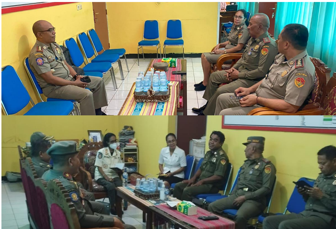
Foto kegiatan koordinasi Satpol PP Provinsi NTT dengan Satpol PP Kabupaten/Kota di Ruang Kasat Satpol PP Provinsi NTT