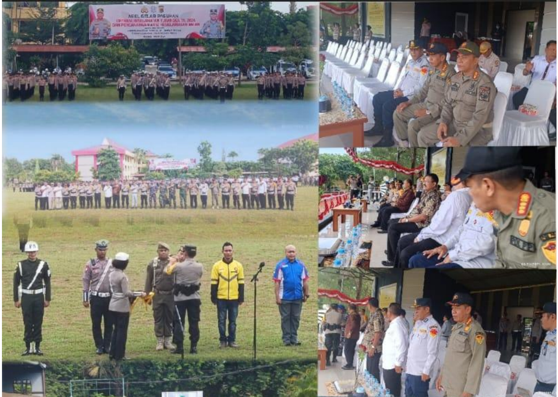
Foto kegiatan Apel Gelar Pasukan Operasi Keselamatan Turangga TA.2024 dan Pencanaan Aksi Keselamatan Jalan