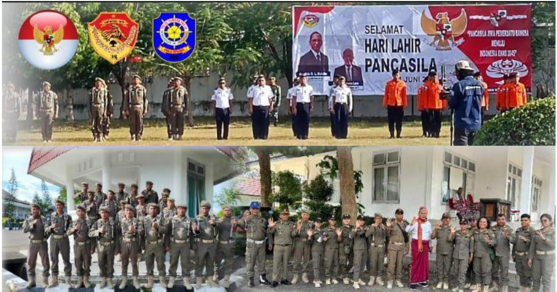
Foto kegiatan Pengamanan dan Peserta Upacara Memperingati Hari Lahir Pancasila