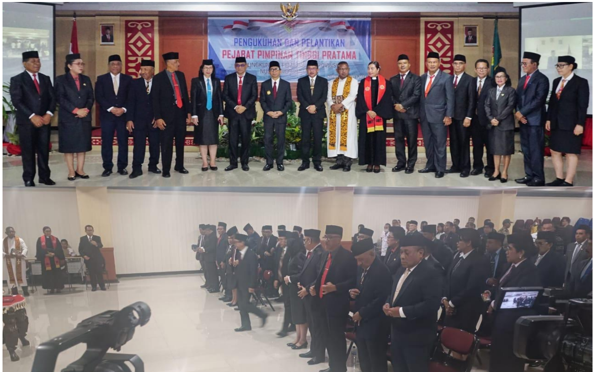
Kegiatan Pelantikan Pejabat Tinggi Pratama