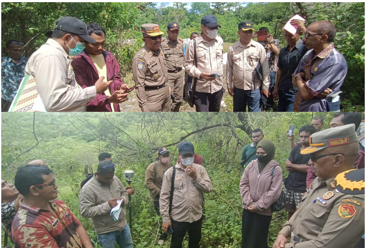
Foto kegiatan Survei Laporan Masyarakat di Manulai