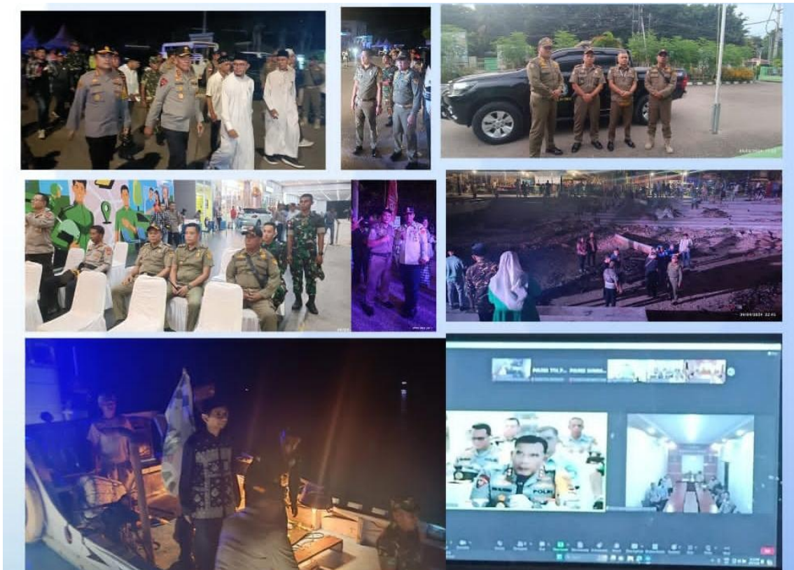
Foto kegiatan Patroli bersama Kapolda NTT Forkopimda dalam rangka menyambut Hari Raya Idul Fitri tahun 2024