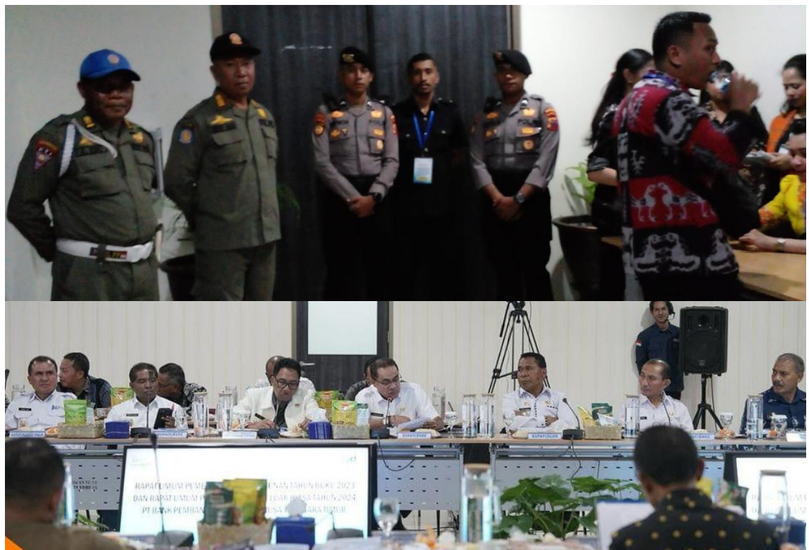
Foto kegiatan Rapat Umum Pemegang Saham Tahunan Tahun Buku 2023 dan Rapat Umum Pemegang Saham Luar Biasa Tahun 2024