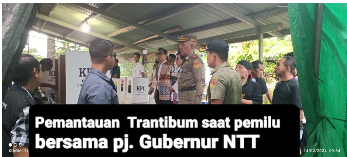
Foto kegiatan pemantauan Trantibum saat Pemilu bersama Pj. Gubernur NTT