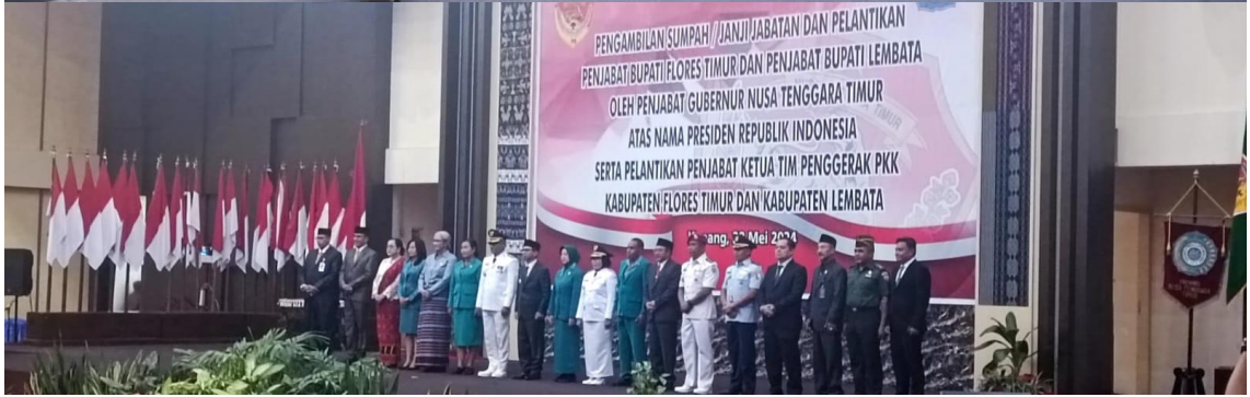
Foto kegiatan Pengambilan Sumpah/Janji Jabatan dan Pelantikan Penjabat Bupati Flores Timur dan Penjabat Bupati Lembata oleh Penjabat Gubernur Provinsi NTT serta Pelantikan Penjabat Ketua Tim Penggerak PKK Kabupaten Flores Timur dan Kabupaten Lembata