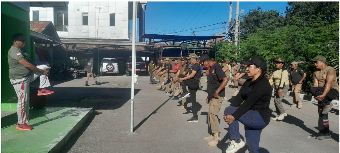
Foto kegiatan Kesemaptaan SATPOL PP Provinsi NTT