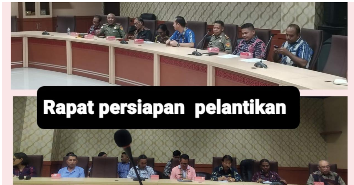
Foto kegiatan Rapat persiapan pelantikan Penjabat Bupati kabupaten Rote Ndao, Timor Tengah Selatan dan Manggarai Timur