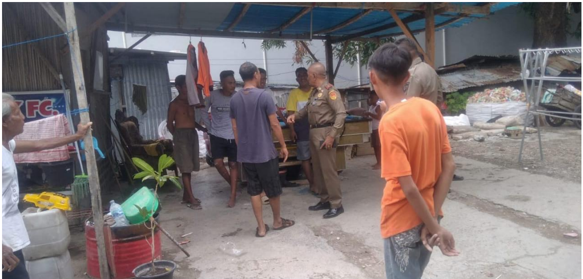
Foto kegiatan Pemantauan Trantibum