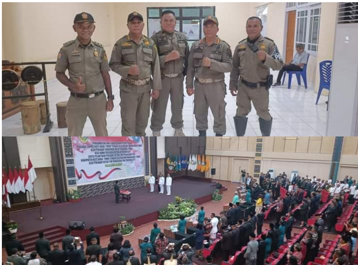
Foto kegiatan pengamanan pengambilan janji jabatandan pelantikan Penjabat Bupati kabupaten Rote Ndao, Timor Tengah Selatan dan Manggarai Timur