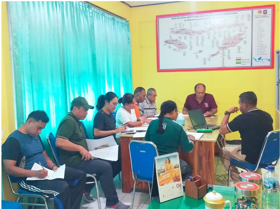
Foto kegiatan Rapat Bersama Pejabat di Ruang Kasat Satpol PP Provinsi NTT