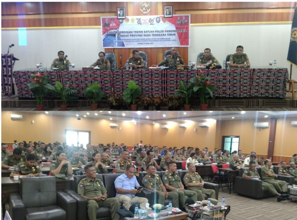
Foto kegiatan Rapat Koordinasi Teknis SATPOL PP Tingkat Provinsi