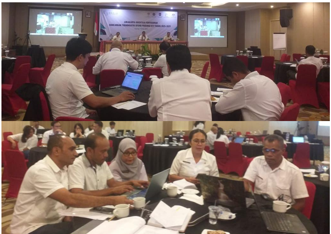
Foto kegiatan Lokakarya Orientasi Penyusunan Rancangan Teknokratik RPJMD Provinsi NTT