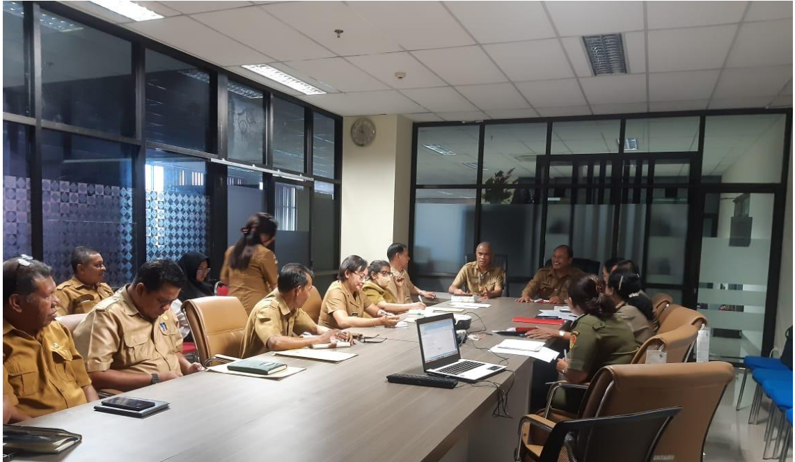
Foto kegiatan Pembahasan Perubahan Anggaran di Badan Anggaran Provinsi NTT