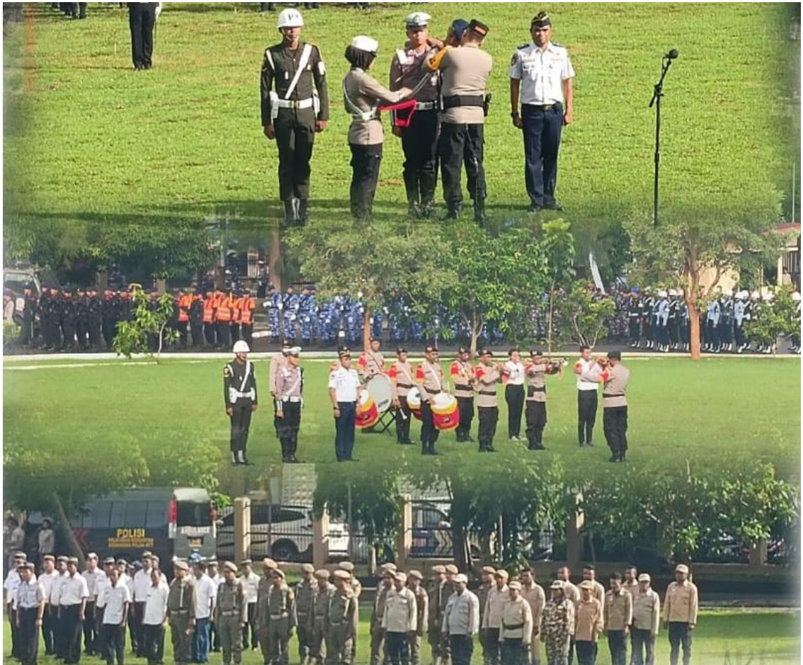
Foto kegiatan Apel Gelar Pasukan Operasi Kepolisian Terpusat “Ketupat Turangga 2024” dalam Rangka Pengamanan Idul Fitri 1445 H Tahun 2024