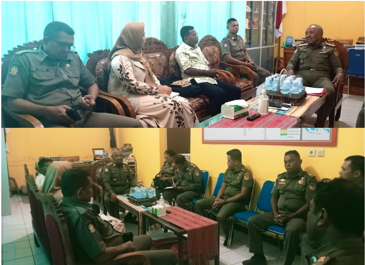
Foto kegiatan Pertemuan dengan Komisi Informasi di Ruang Kasat POL PP Prov.NTT