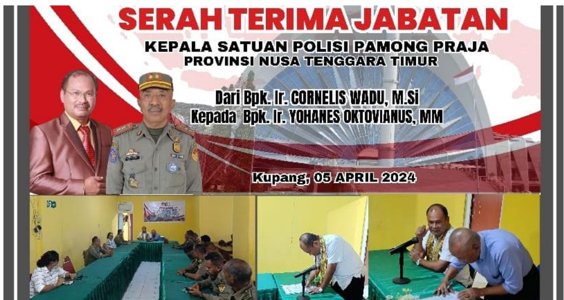
Foto kegiatan Serah Terima Jabatan Kepala Satuan Polisi Pamong Praja Provinsi NTT