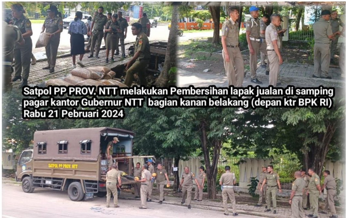
Foto kegiatan pembersihan lapak jualan