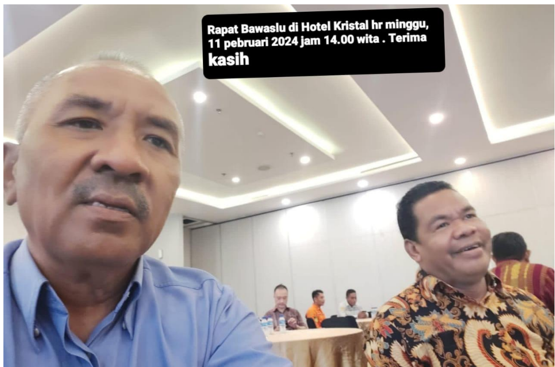
Foto kegiatan Rapat Bawaslu di Hotel Kristal