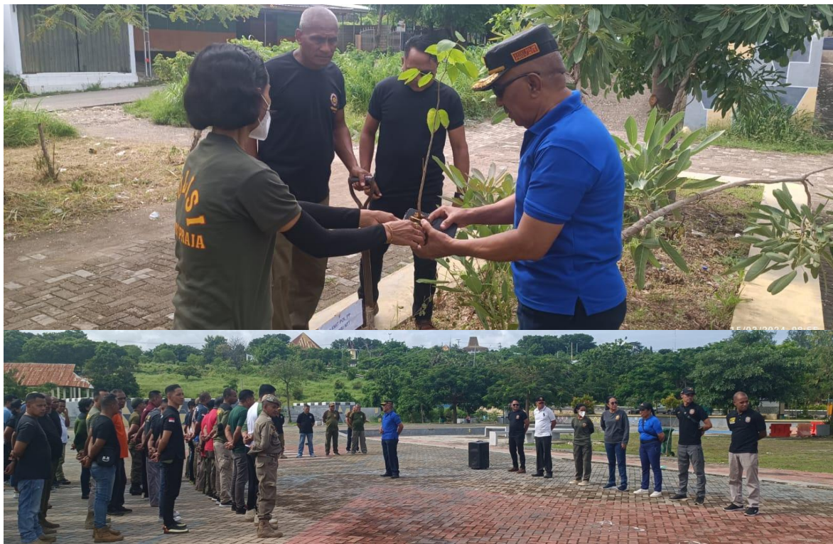
Foto kegiatan Penanaman Pohon di Alun-alun Kota