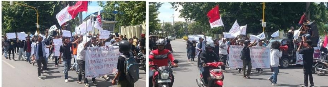
Foto kegiatan Pengamanan Orasi Demo Lanjutan di Depan Kantor DPRD Provinsi NTT