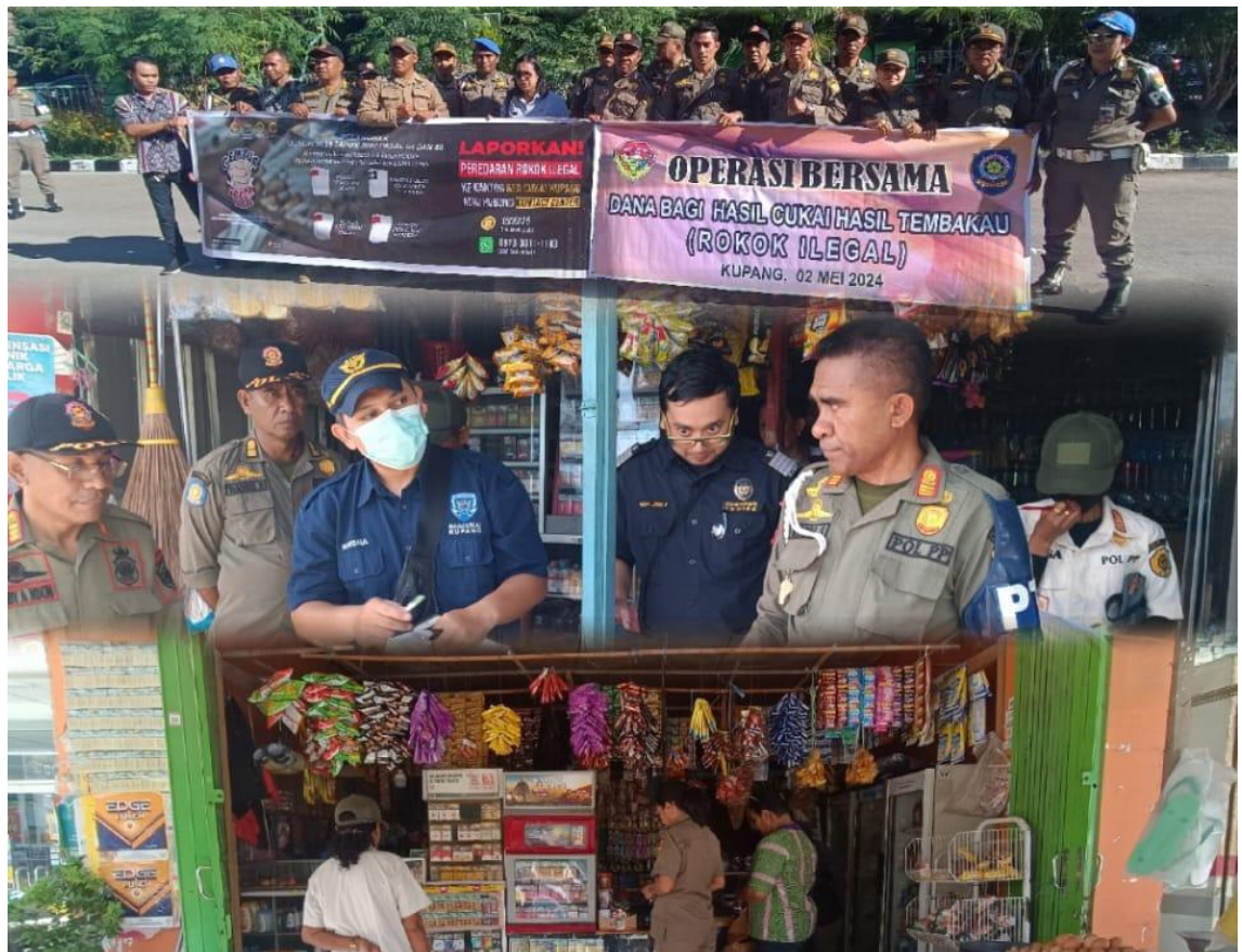
Foto kegiatan Operasi Bersama Dana Bagi Hasil Cukai Hasil Tembakau (Rokok Ilegal)