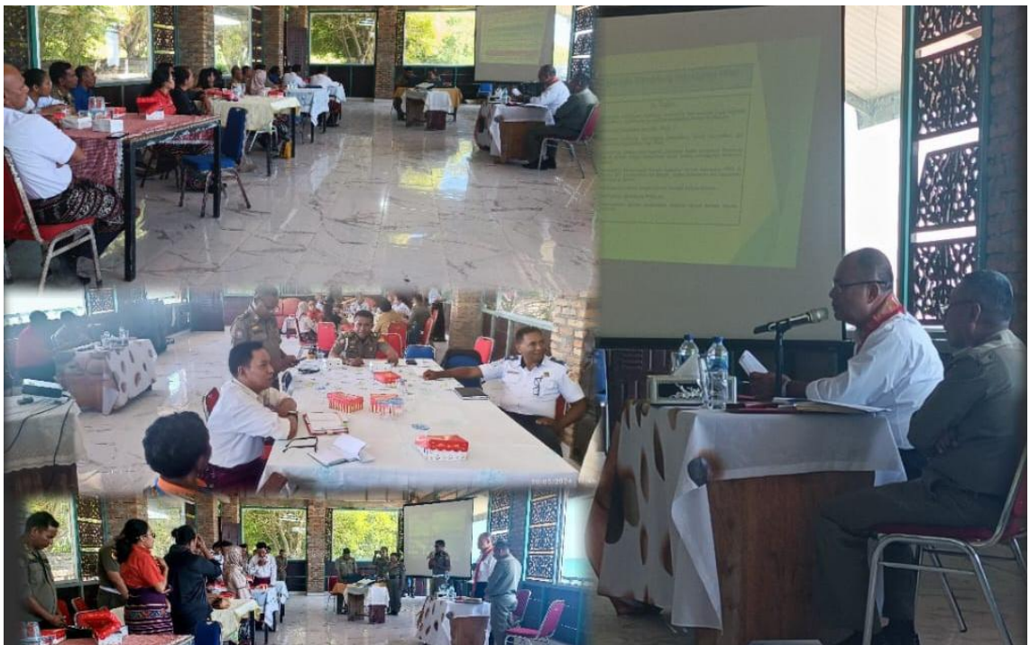
Foto kegiatan Rakor PPNS Lingkup Pemprov NTT