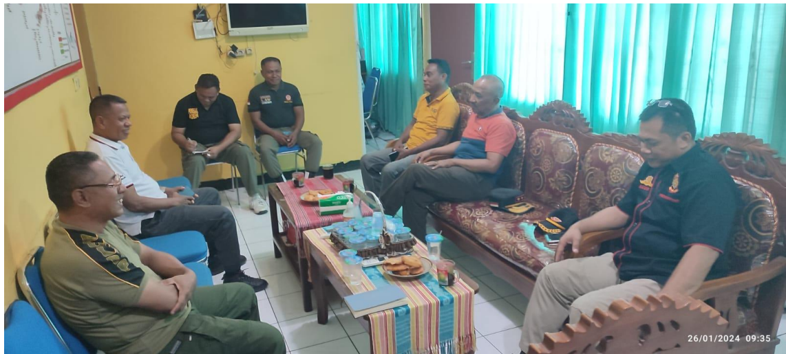
Foto kegiatan Rapat di Ruang Kasat Pol PP Provinsi NTT