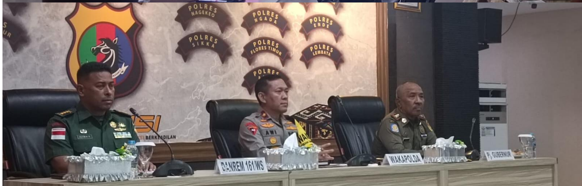
Foto kegiatan Kesiapan Operasi Ketupat Turangga 2024 dalam Rangka Pengamanan Hari Raya Idul Fitri di Polda NTT Tahun 2024