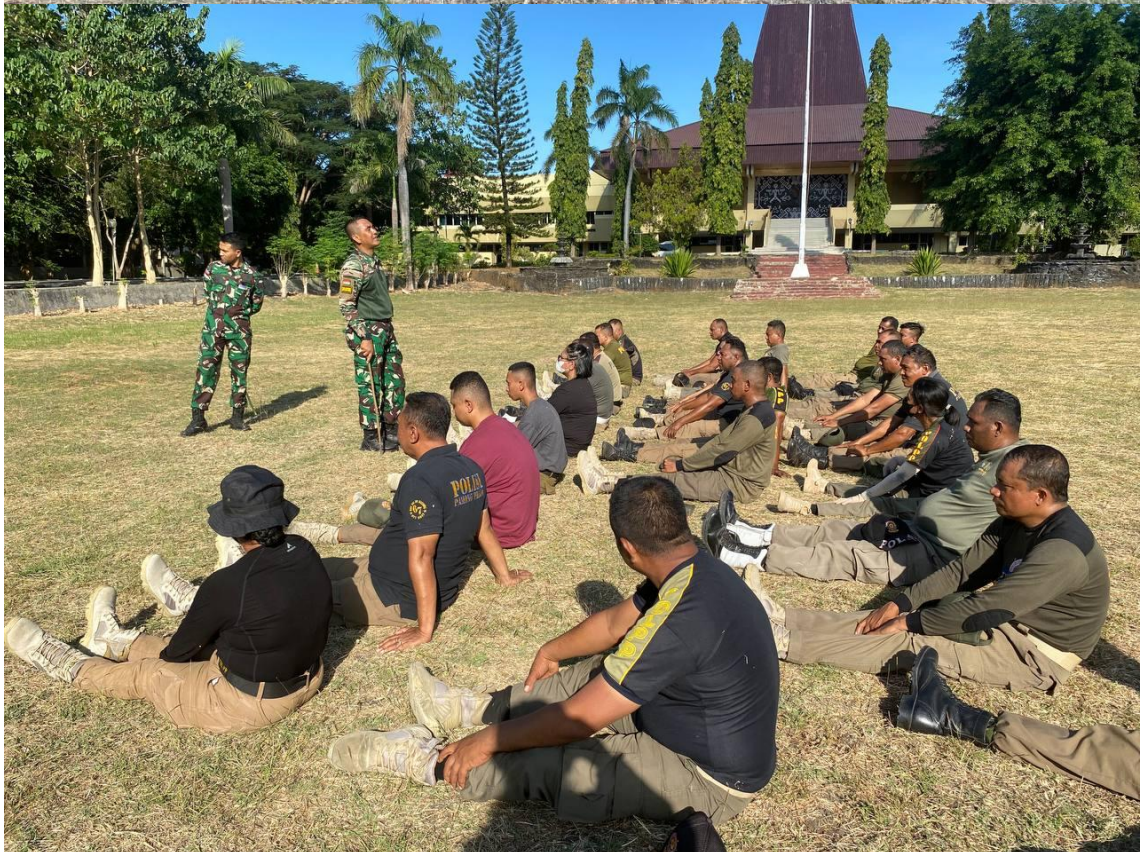
Foto kegiatan Kesamaptan Satpol PP Provinsi NTT