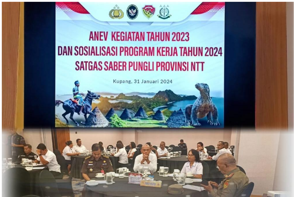
Foto Anev Kegiatan Tahun 2023 dan Sosialisasi Program Kerja Tahun 2024 Satgas Saber Pungli Provinsi NTT