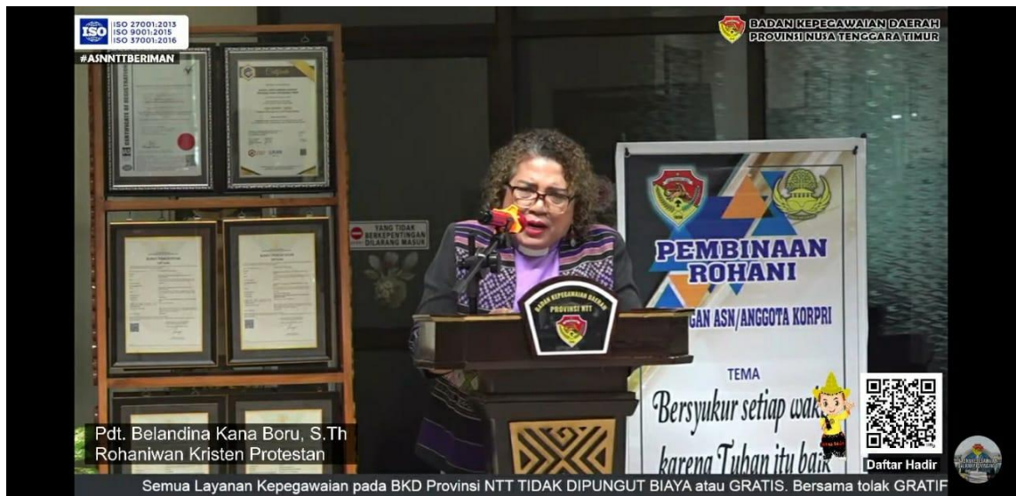
Foto kegiatan Pembinaan Rohani secara Virtual