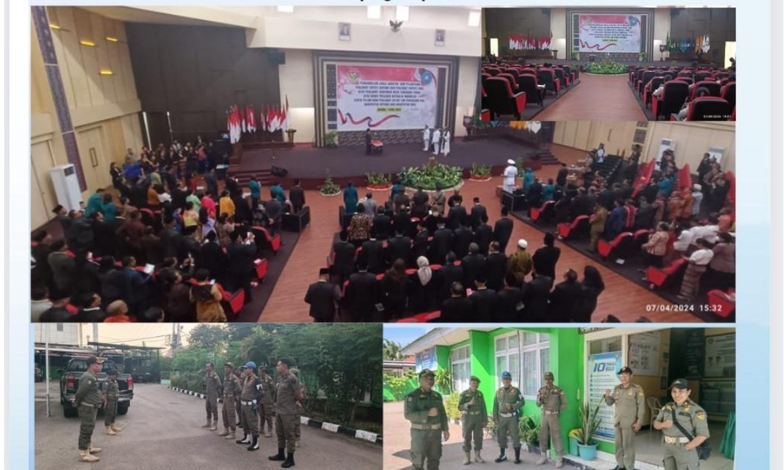
Foto kegiatan Pengamanan Pengambilan Janji Jabatan dan Pelantikan Penjabat Bupati Kupang dan Penjabat Bupati Ende

Pengamanan Pengambilan Janji Jabatan dan Pelantikan Penjabat Bupati Kupang dan Penjabat Bupati Ende oleh Penjabat Gubernur NTT atas nama Presiden Republik Indonesia serta Pelantikan Penjabat Ketua Tim Penggerak PKK Kabupaten Kupang dan Kabupaten Ende bertempat di Aula Eitari Kupang 07 April 2024