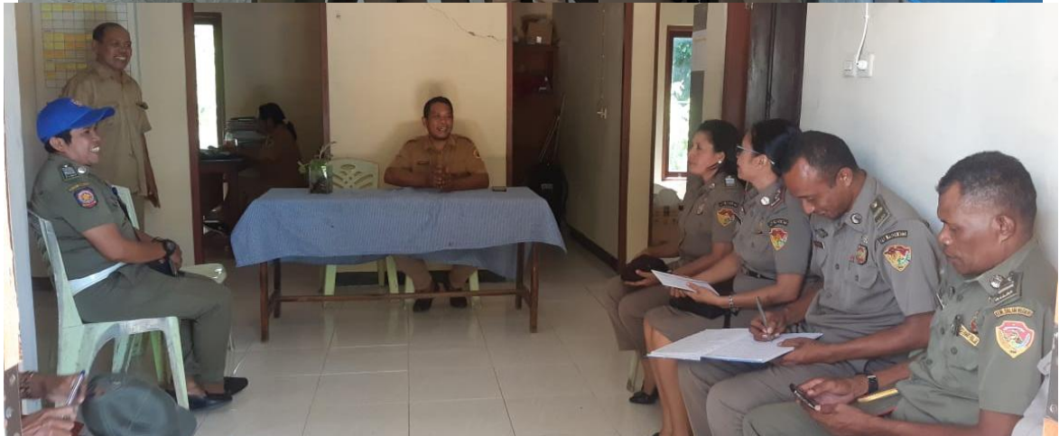
Foto kegiatan Kegiatan Pengambilan Data SPM Di Kawasan Industri Bolok Kabupaten Kupang