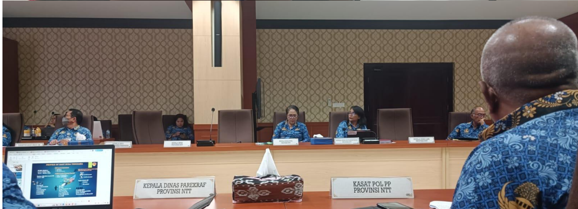
Foto kegiatan Rapat Capaian Kinerja Triwulan II Pj. Gubernur NTT di Ruang Rapat Gubernur NTT