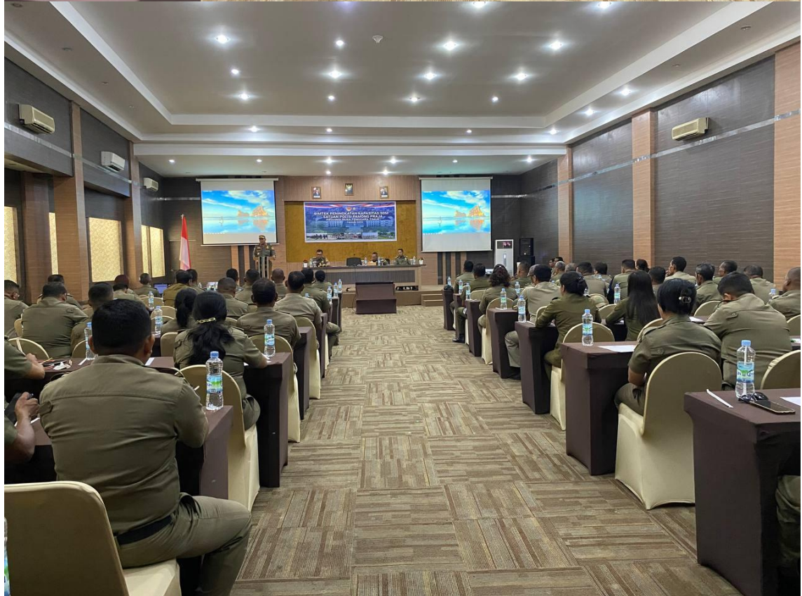
Foto kegiatan Bimtek Peningkatan Kapasitas SDM Satpol PP Provinsi NTT