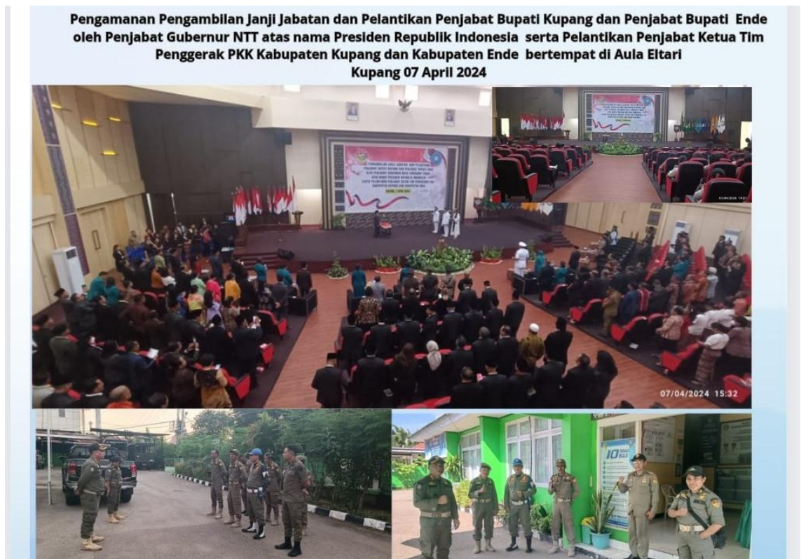
Foto kegiatan Pengamanan Pengambilan Janji Jabatan dan Pelantikan Penjabat Bupati Kupang dan Penjabat Bupati Ende