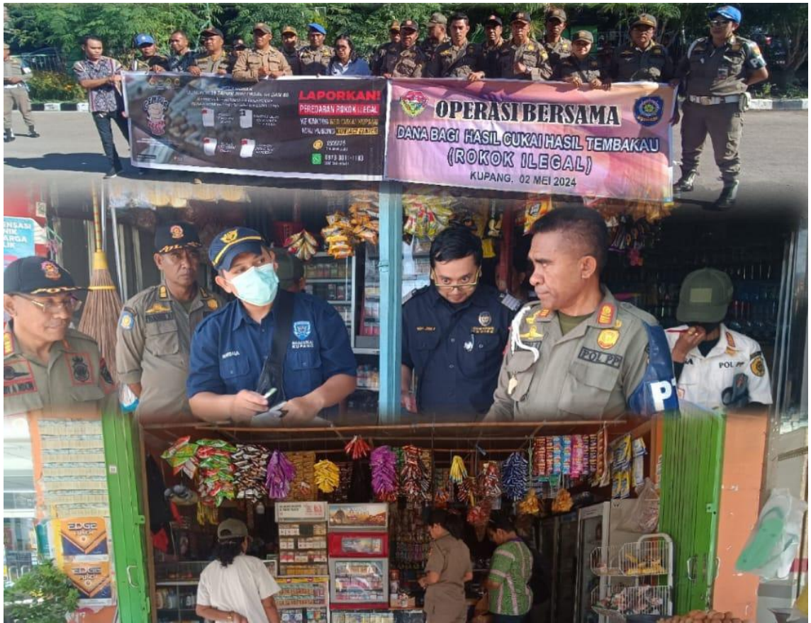
Foto kegiatan Operasi Bersama Dana Bagi Hasil Cukai Hasil Tembakau (Rokok Ilegal)