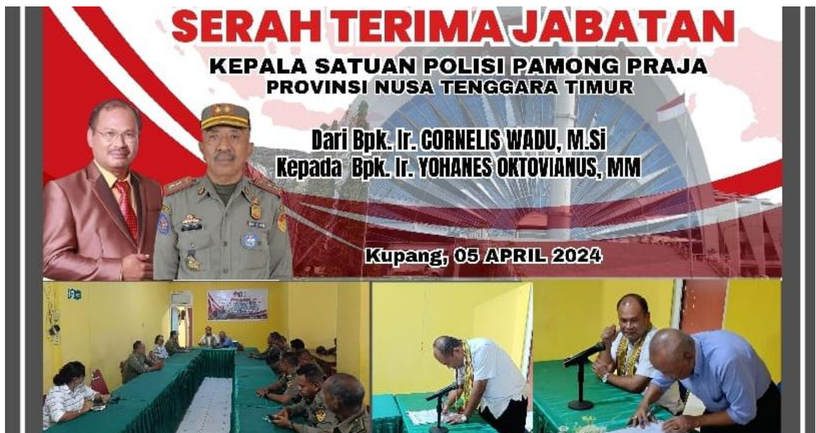
Foto kegiatan Serah Terima Jabatan Kepala Satuan Polisi Pamong Praja Provinsi NTT